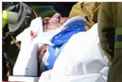
HARRISON FORD PÅ SJUKHUS