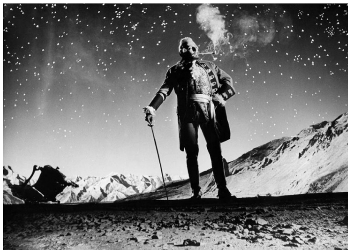
Milos Kopecký som Baron Münchhausen

Film The Outrageous Baron Münchhausen (1962)