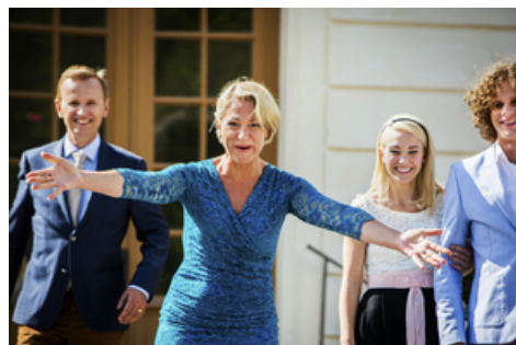
RECENSION: I NÖD ELLER LUST (2015)