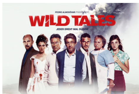
RECENSION: WILD TALES (2014)